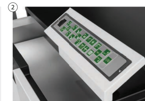
2 Antibakterielle Folientastatur mit oder ohne Beleuchtung Antibacterial foil keyboard with or without illumination