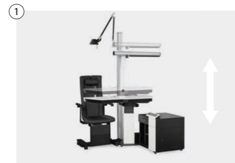
1 Einheit elektromotorisch stufenlos höhenverstellbar (ca. 73-103 cm) Unit electromotive infinitely height-adjustable (approx. 73-103 cm)