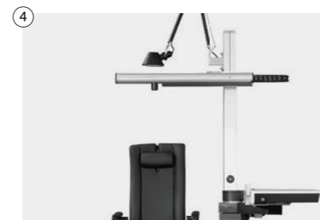
4 Physiologischer Phoropterarm vorgeneigt oder mit stufenloser Neigevorrichtung Physiological phoropter arm pre-tilted or with stepless tilting device