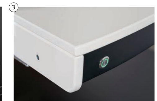
3 Stufenlose magnetische Fixiereinrichtung Stepless magnetic fixing device