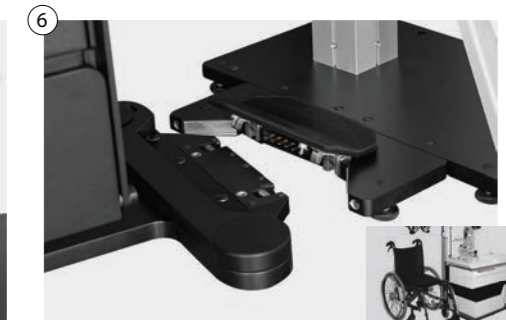
6 Kabellose mechanische Stuhlverschiebung in jede Richtung - Spezialeinklinksystem Wireless mechanical chair movement easily rollable in any direction - special latching system