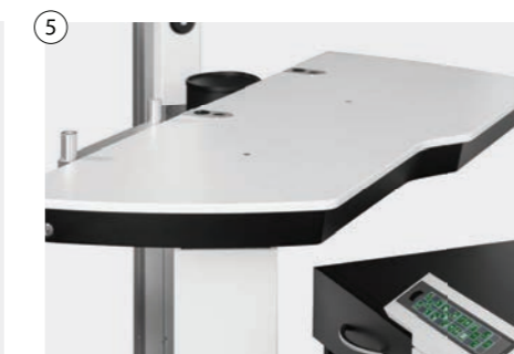
5 Manueller Schwenktisch mit einer oder zwei Positionen mit Magnetbremse Manual swivel table with one or two positions with magnetic brake